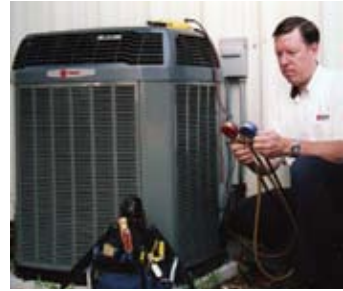
Consumo mensual de kWh de bombas de calor y aire acondicionado central 10 SEER (mínima eficiencia instalada en viviendas de 1992 a 2006) Horas de funcionamiento diarias

El costo de calefacción y enfriamiento de su vivienda representa la parte más grande de la cuenta de la empresa de servicios públicos, el 50% o más en muchos casos. En los meses de verano, el costo del aire acondicionado puede afectar significativamente a su cuenta de electricidad. La bomba de calor eléctrica de alta eficiencia representa la manera más económica de calentar y enfriar su casa.